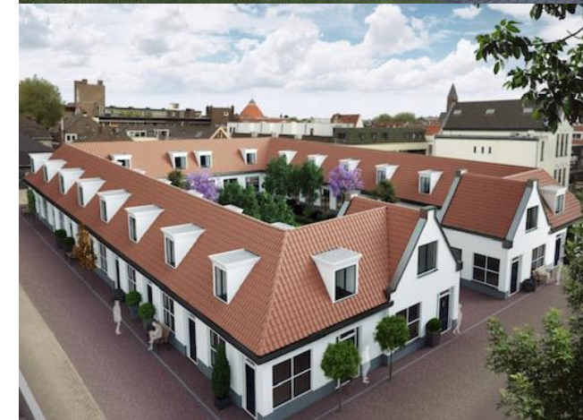
Concepten van nu