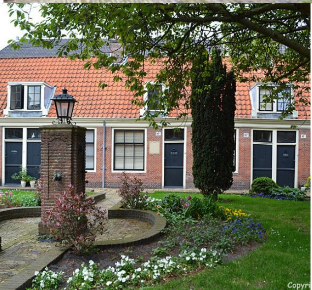
Hofjes van vroeger